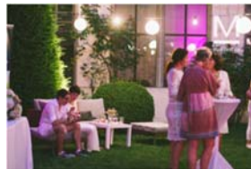
Museums Café Dachauplatz 2-4 93047 Regensburg