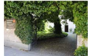
Katholische Akademie Ostengasse 27 93047 Regensburg