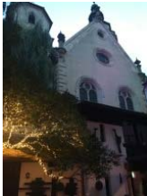
Café Weichmanns Gesandtenstrasse 11 93047 Regensburg