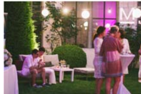
Museums Café Dachauplatz 2-4 93047 Regensburg