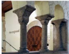
Herzogssaal Domplatz 3 93047 Regensburg